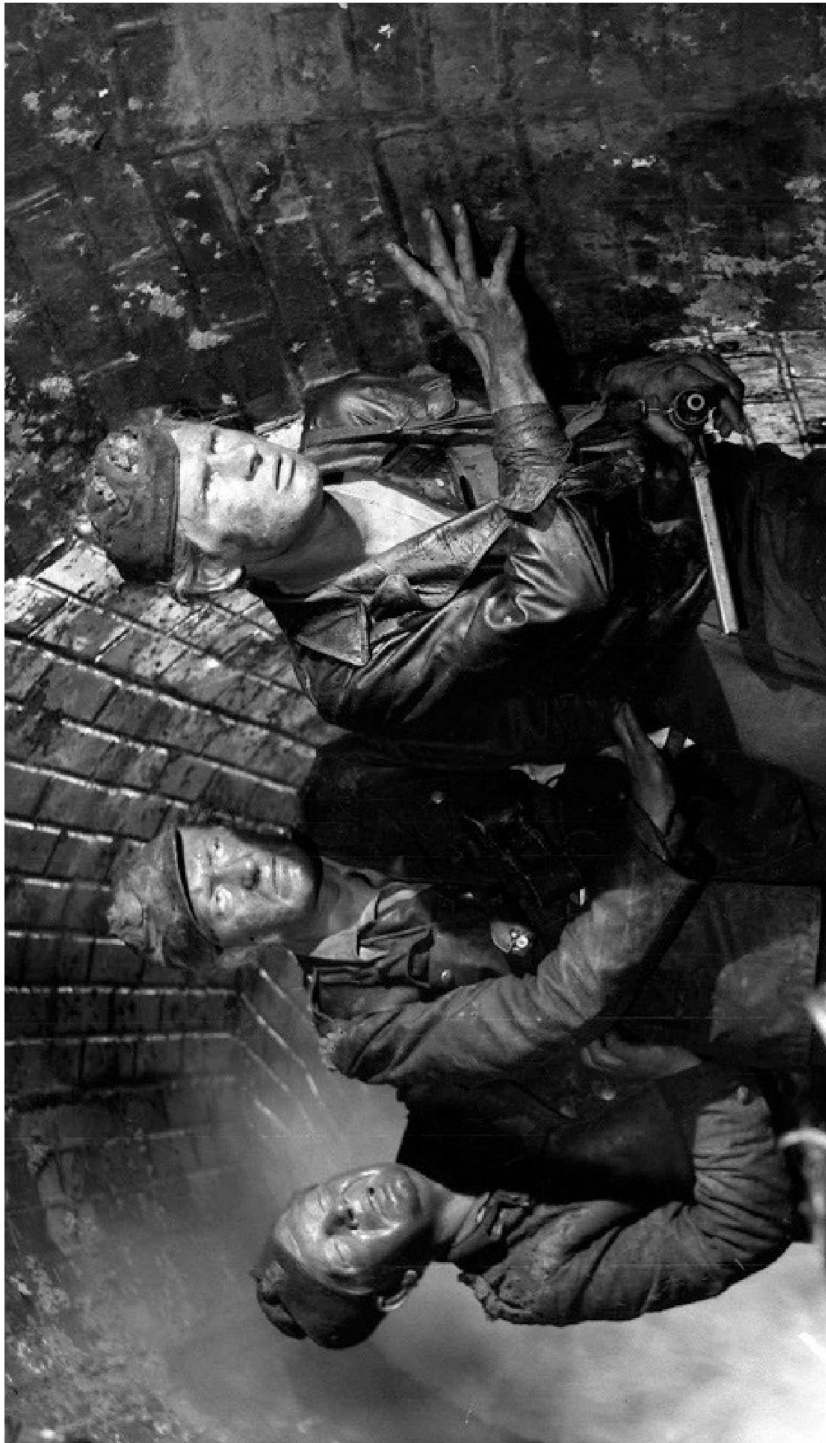
Kadr z filmu "Kanal" w reżyserii Andrzeja Wajdy, 1956, fot. Polfilm / East News; https://culture.pl/pl/dzielo/kanal-rez-andrzej-wajda