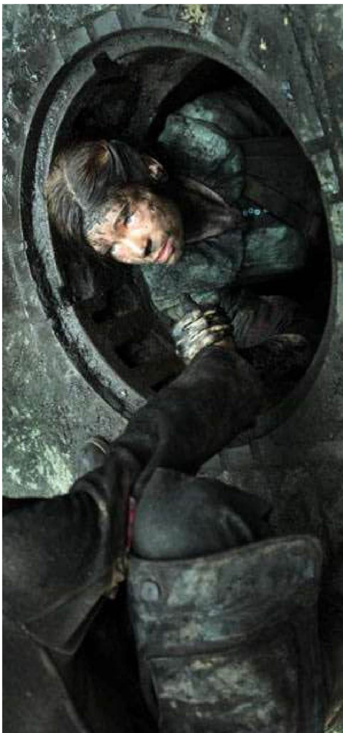
Kadry z filmu Miasto 44